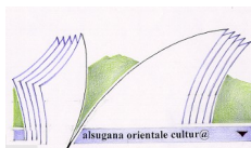
Sistema Culturale Valsugana Orientale