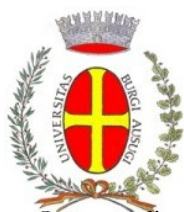
Comune di Borgo Valsugana

approvato con deliberazione consiliare n° 5 dd. 30 gennaio 1996 e successive modifiche (n.41 dd. 04.09.2001, n. 64 dd. 20.12.2005 e n. 45 del 29 agosto 2013)