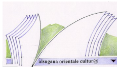
Sistema Culturale Valsugana Orientale