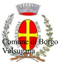
Comune di Borgo Valsugana